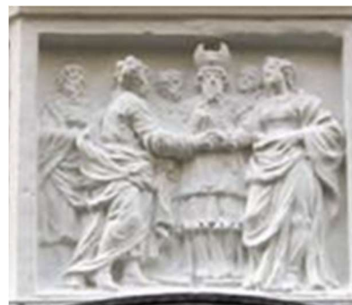
Het huwelijk van Maria en Jozef

De taferelen stellen in volgorde (van links naar rechts) voor: