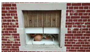
Nu namaak in dit Museum