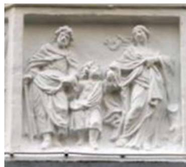
De terugkeer uit Egypte