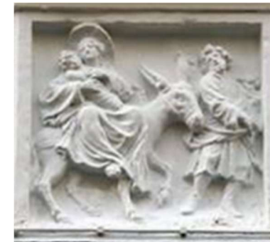
De 'Vlucht naar Egypte