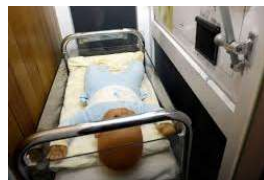
Nu in het écht in Borgerhout bij Moeders voor moeders