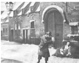
Vroeger aan het Vondelingenhuis

moeder haar baby kan achterlaten. Het aantal vondelingen is gelukkig fel gedaald. Toch wordt er nog gemiddeld 1 baby per jaar opgevangen.