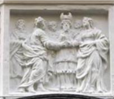
Het huwelijk van Maria en Jozef

De taferelen stellen in volgorde (van links naar rechts) voor: