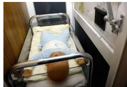
Nu in het écht in Borgerhout bij Moeders voor moeders