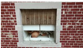
Nu namaak in dit Museum