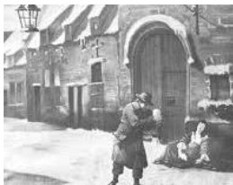
Vroeger aan het Vondelingenhuis

moeder haar baby kan achterlaten. Het aantal vondelingen is gelukkig fel gedaald. Toch wordt er nog gemiddeld 1 baby per jaar opgevangen.