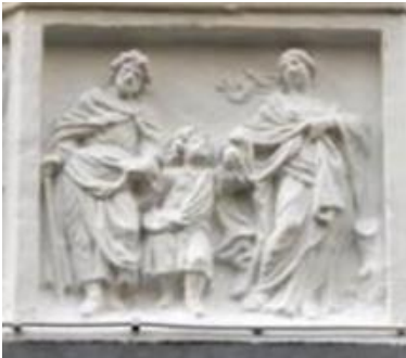
De terugkeer uit Egypte