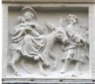
De 'Vlucht naar Egypte